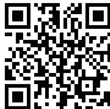
新規登録 QR コード

ログイン後、登録したお写真が画面右上に表示されます。クリックするとデジタル会員証が開きます。編集もそこから可能となります。